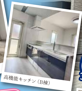
高性能キッチン (B棟)