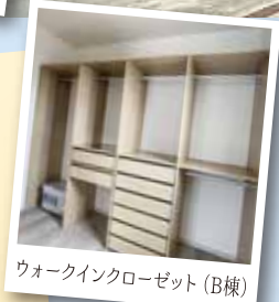
ウォークインクローゼット (B棟)